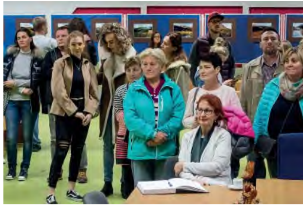
50 podôb Vršatca – na krásne diela od V. Baču sa prišlo pozrieť veľa návštevníkov.