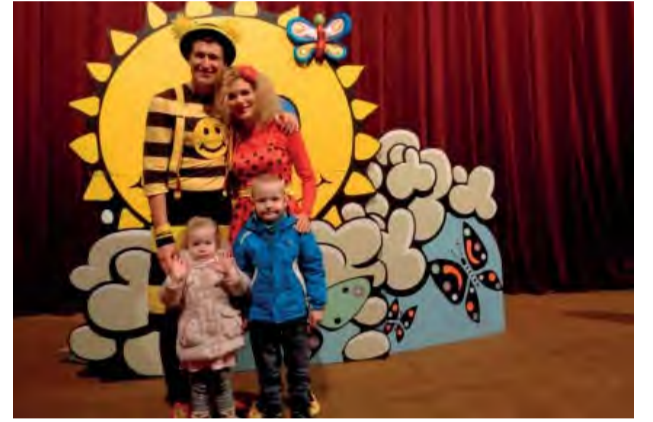
Nezabudli sme ani na tých najmenších. Smejko a Tanculienka...