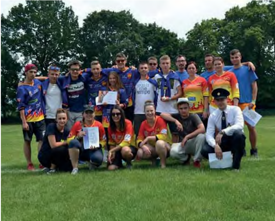
Členovia DHZ Kolačín vo svojich súťažných dresoch.

Na výročnej schôdzi DHZ Kolačín konanej v januári boli po ukončení funkčného obdobia zvolení noví členovia výboru. Starších členov nahradili mladší, ktorí budú od skúsených predchodcov využívať ich dlhoročné skúsenosti.