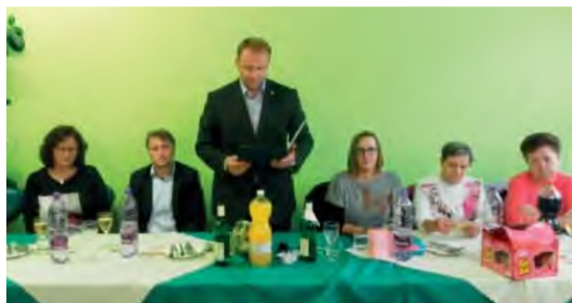
Predstavitelia mesta na slávnostnom posedení so seniormi.

V Zariadení pre seniorov Nová Dubnica si aj tento rok uctili svojich klientov.