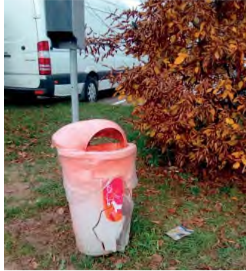
Poškodené koše bude mesto postupne vymieňať.

Na oddelení životného prostredia sa hromadí veľký počet sťažností od psíkarov aj od občanov bez psíkov. Majiteľom psov sa nepáči, že do košov na psie exkrementy ľudia vyhadzujú aj iný odpad. Iní občania sa sťažujú, že v nádobách na komunálny odpad sú vhadzované psie exkrementy.