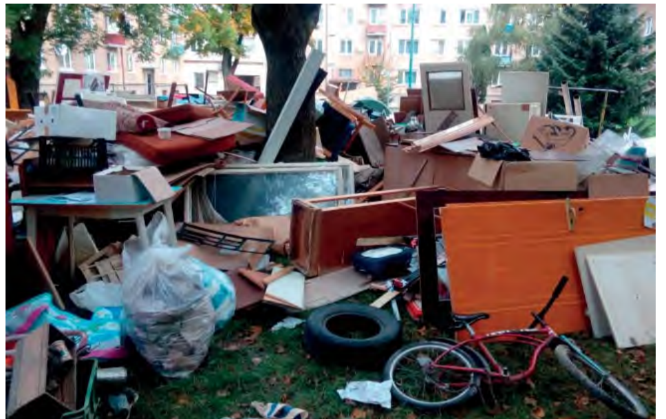
Takto to vyzerá, keď naši obyvatelia vyhadzujú nevhodný odpad na stojiská v okolí domov.

V mesiaci október sa realizoval zvoz objemného odpadu od bytových domov v meste. Vyhodeného odpadu bolo viac než dosť.