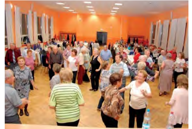
Členovia z Klubu dôchodcov vedia čo je to dobrá zábava.

Starnutie je neodmysliteľnou súčasťou života každého človeka, no každý starne inak. Kalendárny rok je iba tradičným ukazovateľom toho, aby určil čas starnutia.