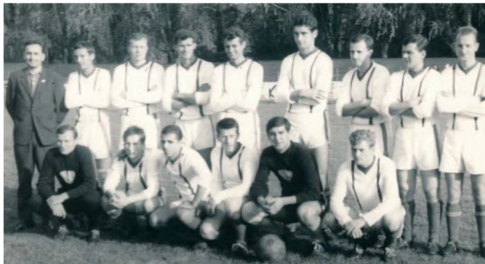
Najúspešnejšie obdobie novodubnického futbalu - začiatok 70. rokov.