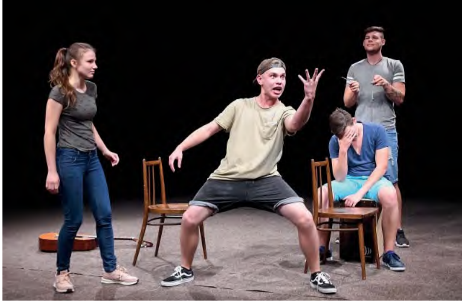
Talented mladí herci z DS Bebčina v inscenácii „Len tak... Pre radosť...“.

Detský a mládežnícky divadelný súbor BEBČINA / Základná umelecká škola Štefana Baláza/ žal v predchádzajúcich rokoch skutočné úspechy.