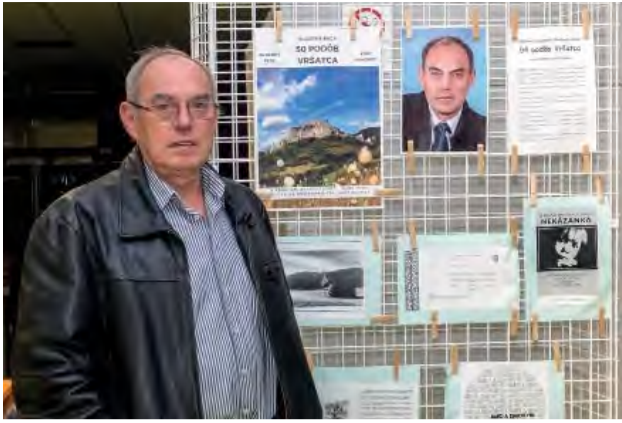
Výstava fotografií Vladimíra Baču v kine Panorex dňa 26.10.