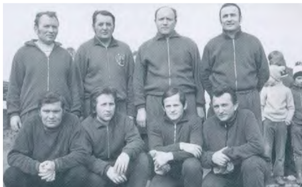
Funkcionári futbalového oddielu.

Keď po roku 1989 vplyvom spoločenských zmien stratil futbal materiálne zázemie,