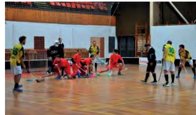
Októbrové zápasy boli fyzicky aj psychicky náročné.

V októbri odohrali naši muži 4 zápasy, z ktorých dva úspešne zvládli a pripísali si do tabuľky dôležité body.