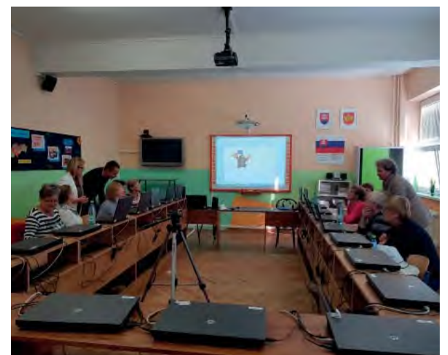
Školenie v počítačovej učebni v ZŠ na Ulici Janka Kráľa.

Mestský úrad Nová Dubnica zrealizoval na základe Druhého komunitného plánu mesta Nová Dubnica dvojtyždňový kurz počítačovej gramotnosti pre seniorov mesta.