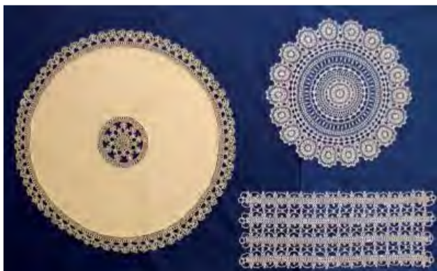
Krása paličkovanvej čipky z Novej Dubnice je vychýrená.

Stalo sa tradíciou, že priestory kina Panorex sa v októbri zaplnia jemnými čipkami, ktoré vytvorili ruky žien. Inak tomu nie je ani tento rok. Naša výstava je jedným z kvetov do kytičky podujatí, uvitej k 60. výročiu mesta Nová Dubnica.