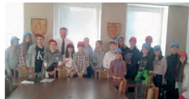
Primátor s našimi plánmi súhlasí, dohodli sme sa na spolupráci

Roots & Shoots (korene a výhonky) je globálny vzdelávací program britskej prírodovedkyne Jane Goodall. V súčasnosti je do neho zapojených viac ako 100 krajín.