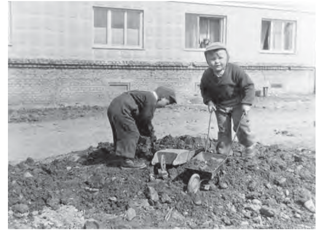
Ešte túto kopu a mesto máme postavené...