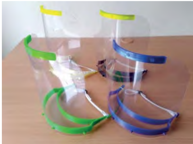
3D ochranné štíty daroval Amavet klub aj mestu (zariadeniu pre seniorov, mestskej polícii) ĎAKUJEME!

Žiaci novodubnických škôl, ktorí sú členmi nášho Amavet klubu č. 966 – Pöllö (Asociácia mládeže pre vedu a techniku – poz. red.) sa rozhodli prispieť k boju proti Covid-19 spôsobom im vlastným, teda 3D tlačou.