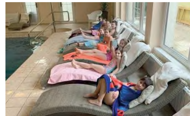
Ešte pred zatvorením školských zariadení si deti užili denný tábor naplno.

Centrum voľného času pripravilo jarný tábor pre novodubnické deti. Keďže počasie nám veľmi neprialo na zimné hry v snehu, zariadili sme sa ináč.