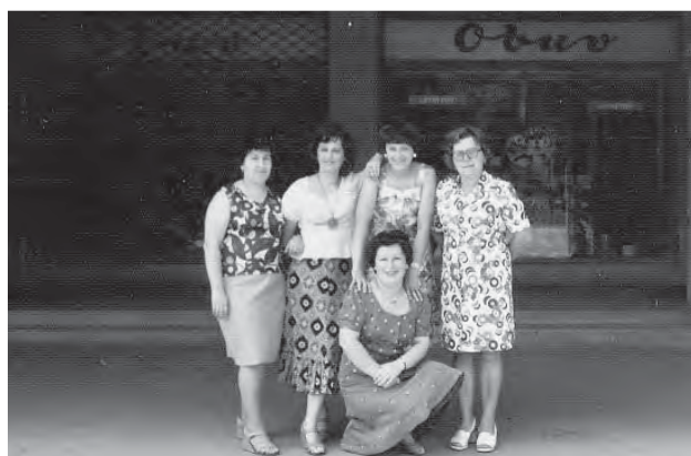
Predavačky pred obchodom, ktorý sa nachádzal v priestoroch súčasných potravín FRESCH.