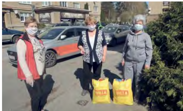
Únia žien sa ochotne podujala doručiť balíčky od sponzorov.

Spoločnosť BILLA sa v súčasnej neľahkej situácii v súvislosti s koronavírusom rozhodla, že pomôže tej najzraniteľnejšej a najohrozenejšej skupine obyvateľstva - ľuďom nad 65 rokov.