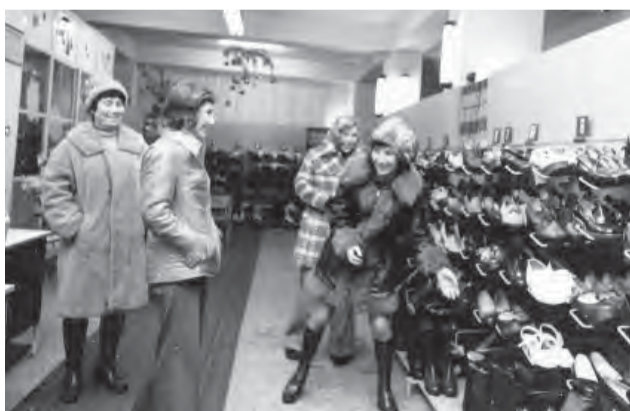
Topánky do vychýrenej predajne obuvi chodili nakupovať aj ženy z neďalekej Moravy.