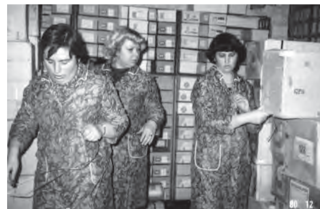
Prípraviť nový tovar nebolo jednoduché. Predavačky museli nosiť ťažké krabice z dvora za predajňou.