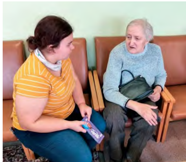
Prejavíť záujem a porozprávať sa - to je pre ľudí v zariadení na nezapltenie.

Dňa 27. februára osviežili všedné dni obyvateľov Zariadenia pre seniorov celkom mladí návštevníci z nášho mesta.