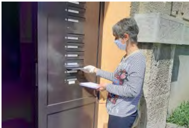
Obyvatelia od 60 rokov si v schránke našli vhoďené rúško v obálke s pečiatkou mesta.

V minulom čísle mestských novín sme vás informovali o zriadení linky sociálnej pomoci, ktorú zriadilo mesto.