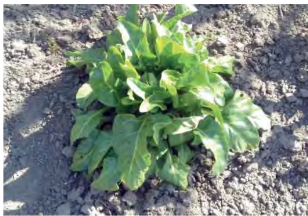
Pri zakladaní záhonov na jar je dôležité aj správne umiestnenie jednotlivých plodín.

Naše záhradky ožívajú jar- ným ruchom. Po príprave pôdy prichádza na rad sejba a výsadba priesad. Skúsení záhradkári majú menej problémov, ale začiatočníci pravdepodobne radi príjmu niekoľko dobrých rád.