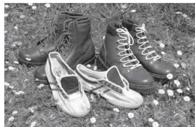
Takéto retro krásky ste nám z tej doby darovali do historickej izby.