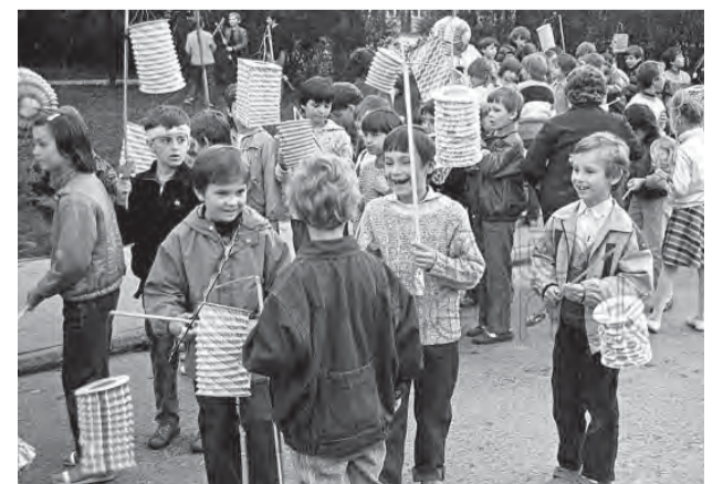
Darujte aj vy svoje spomienky...