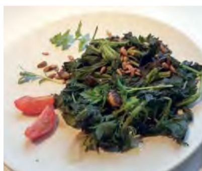
Príroda nám ponúka nejedno lokálne zdravé jedlo v bio kvalite zdarma

Jarné kvety a bylinky nás tešia svojou krásou a vôňou, okrem toho sú však veľmi vhodné aj na tanier.