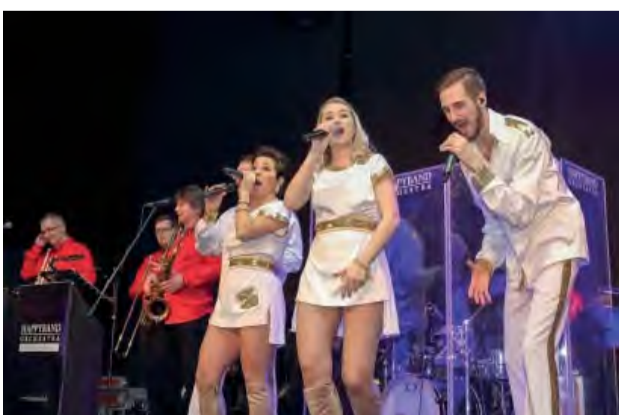
Tanečný program a skvelá ABBA REVIVAL.