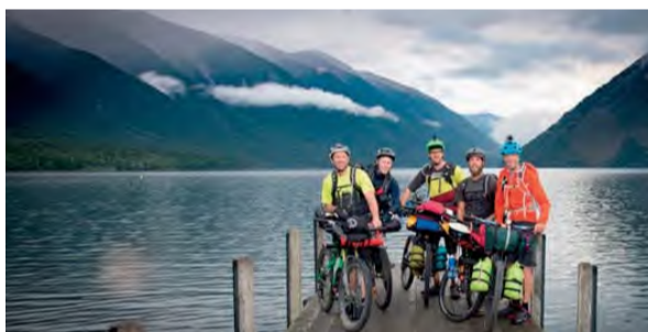
18:30 - Waia-Toa Odyssey , Nový Zéland, 2017, 13 min., réžia: Simon Waterhouse, jazyk: anglický, české titulky