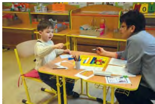
Dieťa na zápise v SZŠ.

Dňa 10. 4. 2019 sa od 15.00 do 17.00 hod. koná v Súkromnej ZŠ zápis.