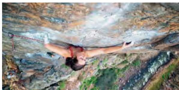
18:05 - Stumped , USA, 2017, 25 min., réžia: Ior Keating, jazyk: anglický, české titulky

Medzinárodný filmový festival Expedičná kamera ja najväčšia cestovateľská a outdoorová akcia v Čechách i na Slovensku. Tento unikátny projekt prináša najlepšie filmy sezóny z celého sveta i novinky z domácej produkcie. 6 filmov plných dobrodružstva. Lezenie s jednou rukou, šesťdňový prechod Nového Zélandu na kajaku a bicykli, prvovýstup na kašmírskoe Tupendeo, na bicykli Tour Divide - od hraníc Kanady po Mexiko, dobrodružstvo v amazonskom pralesi i slovenský film Kroky na hrane o 170km behu z Osvienčimu do Žiliny po stopách Rudolfa Vrba a Alfreda Wetzlera. Prestávka v premietaní o 20.00 hod. Vstupné: 2,50 €.