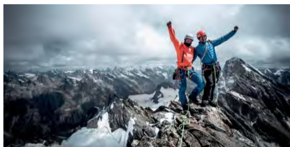
18:45 - Tupendeo , Švajčiarsko, 2016, 26 min., réžia: H. Ambühl/ Visual Impact, jazyk: anglický, nemecký, české titulky