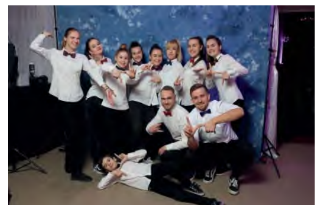
Tanečná škola LT - tanec predviedla skvelú choreografiu vytvorenú špeciálne pre túto príležitosť.