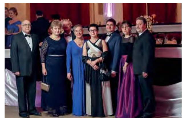
Na ples prijali pozvanie aj predstavitelia družobného mesta Dubna.