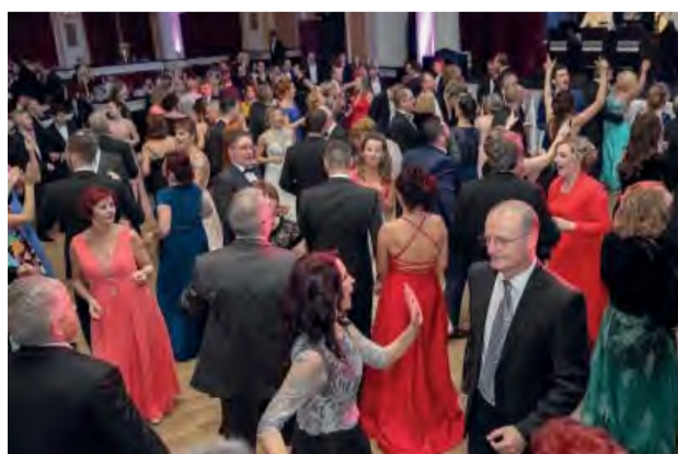
Vynikajúca zábava počas celého plesu.