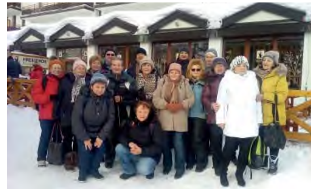
Čerstvý tatranský vzduch a dobrá nálada boli zárukou skvelého výletu na Hrebienok.

Po ich prehliadke sme sa osviezení čerstvým tatranským vzduchom pomaly