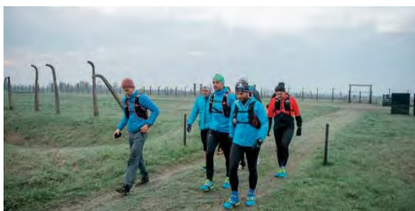
21:05 - Kroky na hrane , Slovensko, 2017, 42 min., réžia: Viliam Bendík, jazyk: slovenský