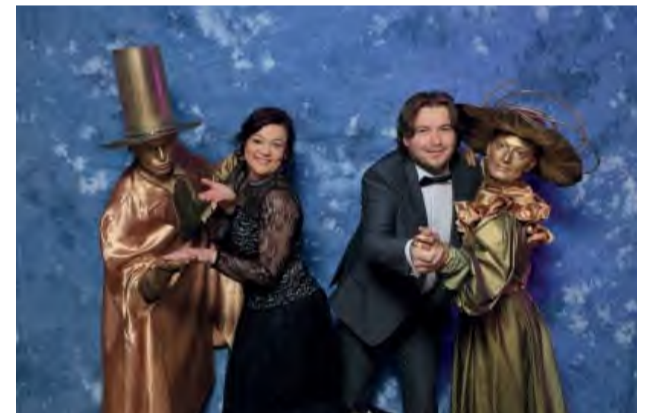
Živé sochy boli zaujímavým spestrením plesu.