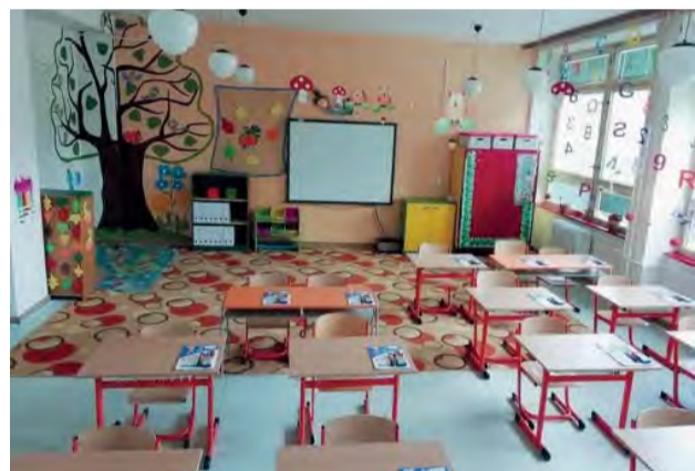
Triedy pre zvedavých predškolákov sú už pripravené.

Pozývame vás na zápis do prvého ročníka Základnej školy sv. Jána Bosca v dňoch 9. a 10. apríla 2019 (utorok a streda) v čase od 14.30 – 17.30 hod.