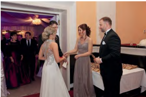
Hostitelia plesu každého osobne privítali.