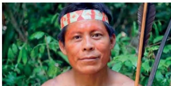
20:20 - Matsés , Česká republika, 2017, 45 min., réžia: Miroslav Haluza, jazyk: český