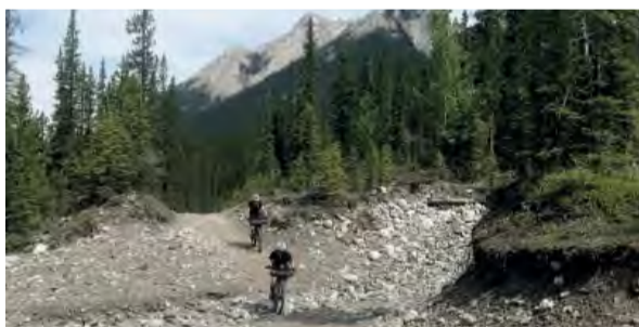
19:15 - Divided , Veľká Británia, 2017, 39 min., réžia: Rickie Cotter, Lee Craigie, jazyk: anglický, české titulky