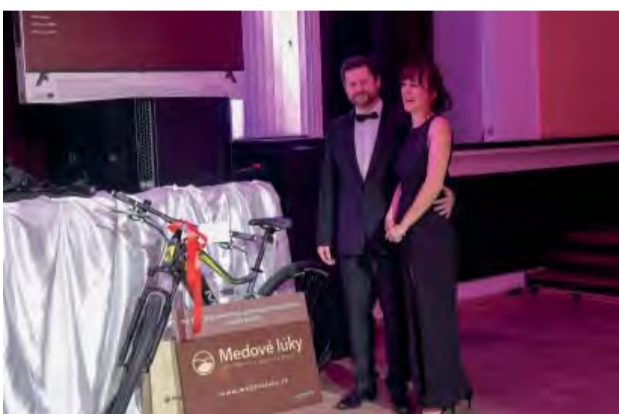
Šťastná majiteľka 1. ceny v tombole - elektrobicykla, ktorý prevzala od darcu riaditeľa Reality 4U.