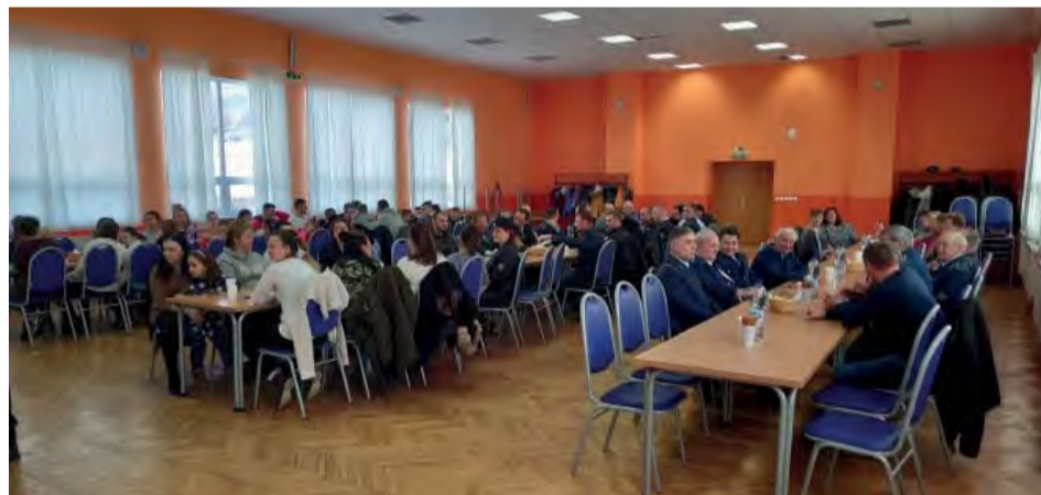
Fotografia z výročnej členskej schôdze DHZ Kolačín.

Členovia Dobrovoľného hasičského zboru Nová Dubnica - Kolačín sa stretli 30. januára v Kultúrnom dome v Kolačine, aby zhodnotili svoju činnosť, odmenili najaktívnejších a diskutovali o svojich plánoch na rok 2019.