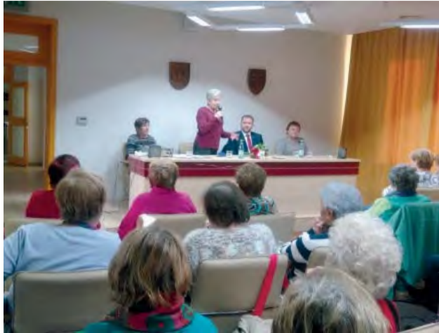
Účastníci Akadémie strieborného veku diskutovali s primátorom mesta.