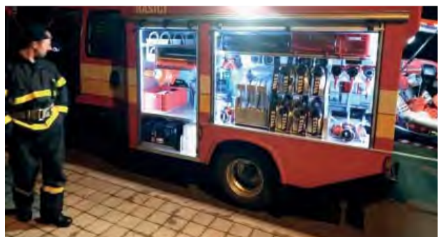
Nové Iveco bude pomáhať hasičom v boji so živlami.