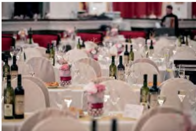
Výzdobu priestorov realizovalo kvetinárstvo Kvety u Guru.