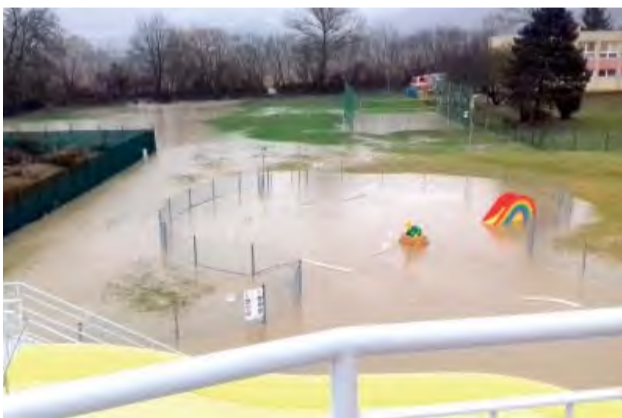
Smutný pohľad na „kúpajúce sa“ kúpalisko.