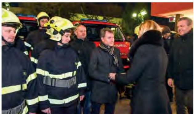
Odovzdávanie sa zúčastnila aj ministerka vnútra SR Denisa Saková.