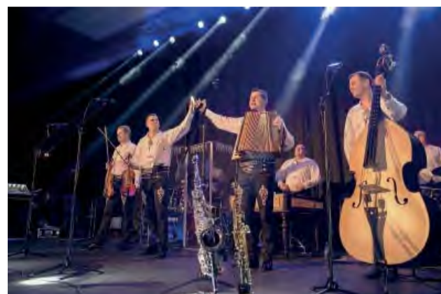
Hudobným hosťom večera boli temperamentní Kollárovci, ktorí vystúpili s kolom vlastných i ľudových goralských piesní.