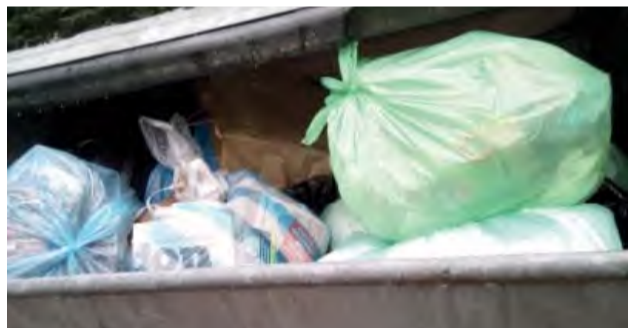
Dôsledné vytriedenie odpadu by malo byť štandardom, inak bude poplatok za odpad narastať.

V roku 2019 sa systém nakladania s odpadmi v Novej Dubnici pre mnohých dramaticky menil – jednak sa výraznejšie zdvihol poplatok za odpad, jednak sa zredukoval vývoz odpadu od rodinných domov na dvojtýždňový interval. Pre mesto sa zase výrazne dvihli poplatky za skládkovanie.