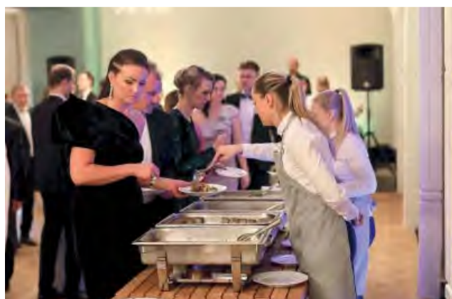
Večera podávaná v salóniku formou teplého a studeného bufetu.