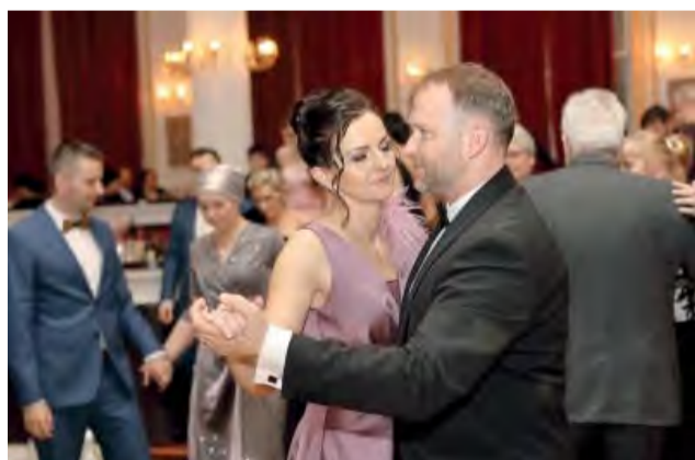
Primátorský pár v rytme valčíka.