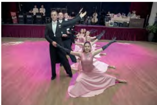
Noblesnú atmosféru podčiarklo svojim vystúpením šesť párov tanečníkov z Tanečnej školy Paškovicov.