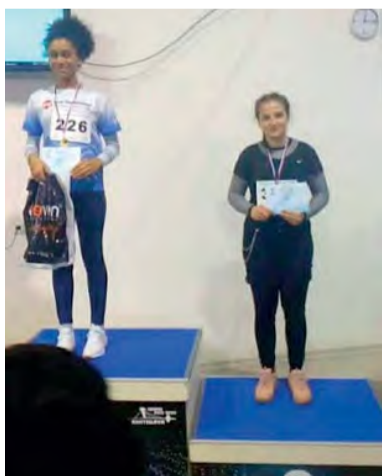
Úspešná Novodubničanka na stupni víťazov.