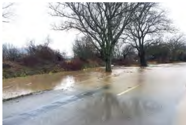
Vybrežené koryto Kolačinskeho potoka pri ceste smerom na Príles.