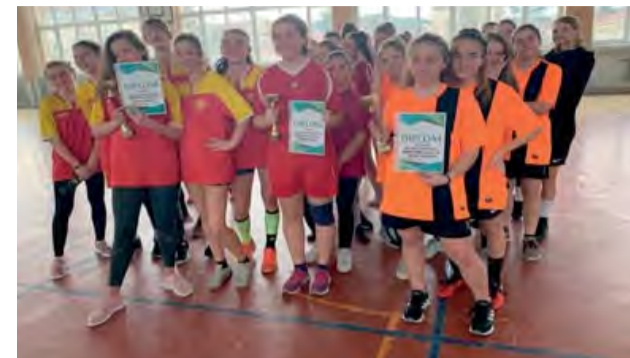
Všetky spokojné víťazky po basketbalovom súboji.