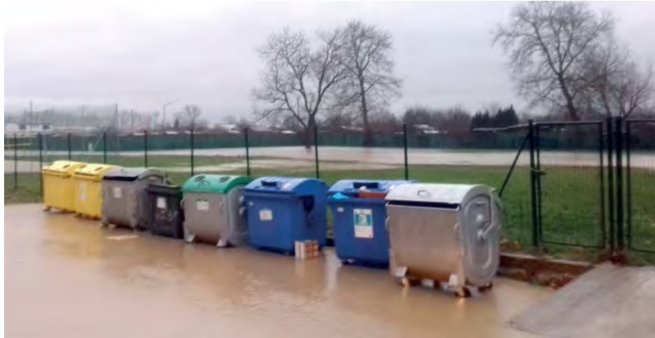
Voda z vyliateho koryta neobišla ani susednú jedáleň školy.