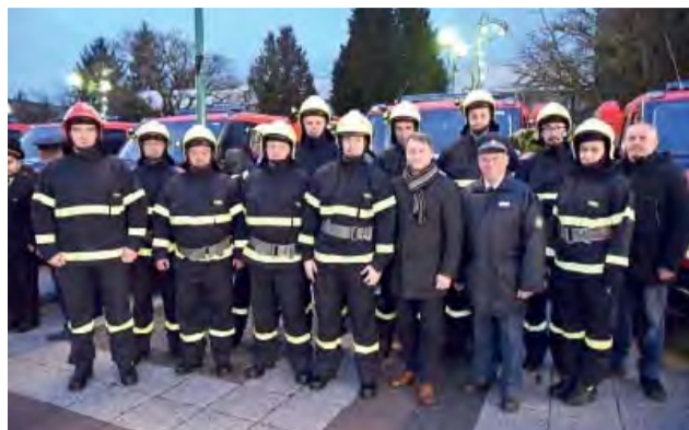
Kolačinsky dobrovoľný hasičský zbor a zástupca primátora mesta pripravení na prevzatie auta.

Dňa 30. januára 2020 sa v Považskej Bystrici pre dobrovoľných hasičov Trenčianskeho kraja konalo odovzdávanie vozidiel Iveco Daily, určených pre 17 miest a obcí.