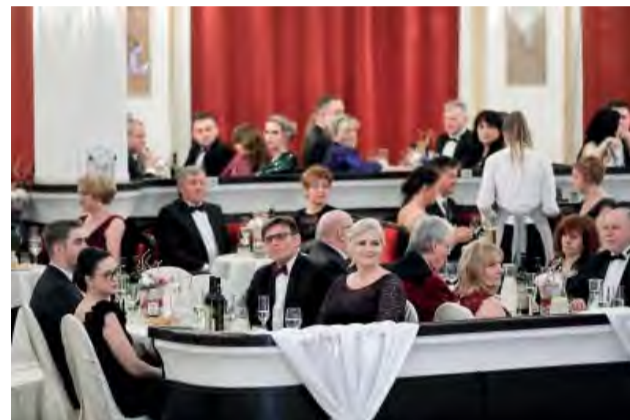
Pozvanie na ples prijali aj primátori miest Trenčianske Teplice, Dubnica nad Váhom, Nemšová, Ilava a starostka obce Uhrovec.