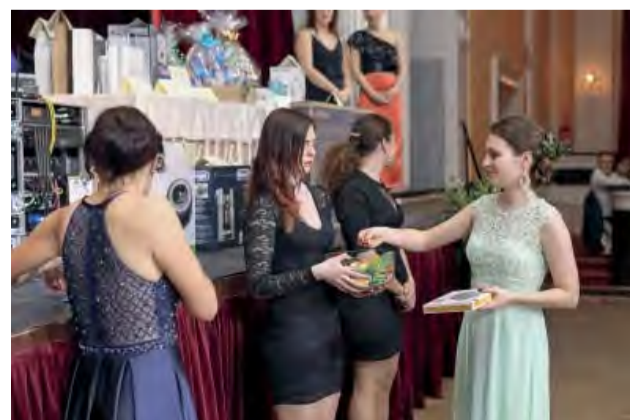
Po polnoci prítomných zabavilo žrebovanie tomboly, v ktorej súťažili aj o televízor, či jazdu značkovým mercedesom.