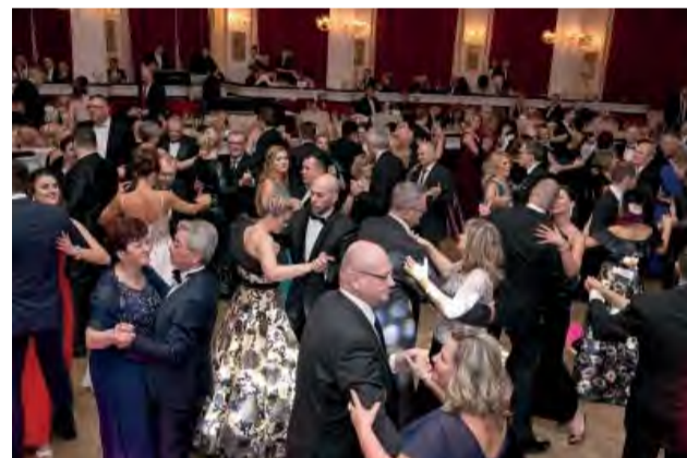
Po vystúpení tanečníkov a po úvodnom tanci hostiteľského páru si nikto z prítomných nenechal ujsť kolo spoločenských tancov.