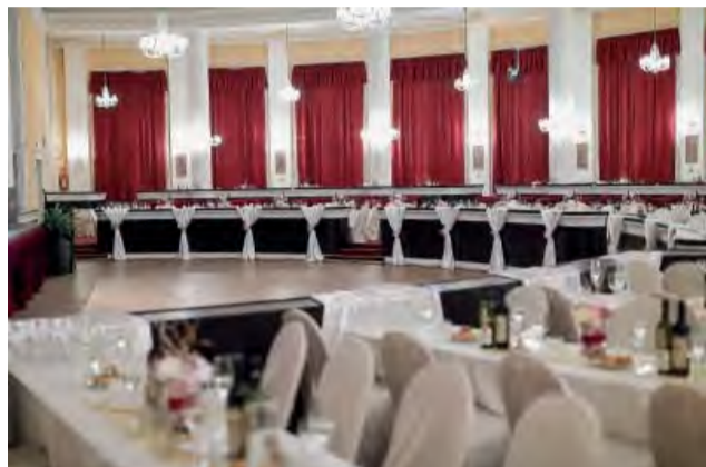
Modernizácia priestorov sa nedotkla historickej sály, ktorá dýchala tradíciou a eleganciou.

Viac ako 280 hostí sa stretlo na 18. ročníku Reprezentačného plesu nášho mesta, ktorý sa konal v zrekonštruovaných priestoroch teplického Kursalónu. Niektorí z nich sa tohto podujatia zúčastňujú pravidelne, v tomto roku si novodubnický ples našli i hostia z Námestova či moravského Slavičína. Hostiteľom večera bol samozrejme primátor mesta s manželkou.