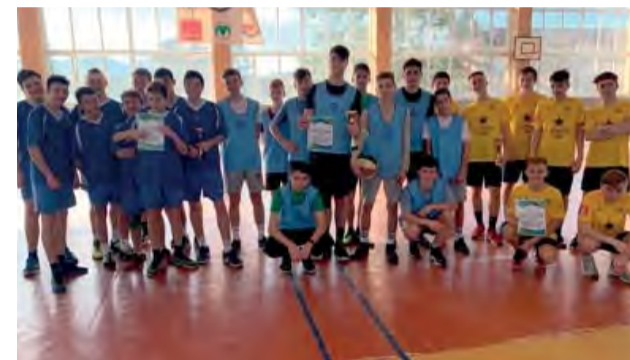
Vítané družstvá chlapcov - 1. miesto neuniklo ZŠ na Ulici J. Kráľa Nová Dubnica.

Druhý februárový týždeň sa niesol v znamení basketbalu. V dňoch 11. a 13. februára prebehli v dopoludňajších hodinách v športovej hale v Novej Dubnici okresné kolá basketbalu základných škôl.