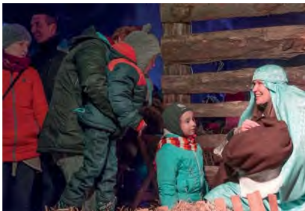
Najmenších zaujali zvieratká aj Svätá rodina s malým Ježiškom.