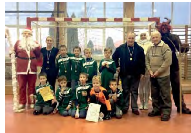
Mladých futbalistov potešil Mikuláš a sladké dobroty.