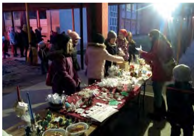
Na živý betlehem sa prišlo pozrieť vyše 300 ľudí.