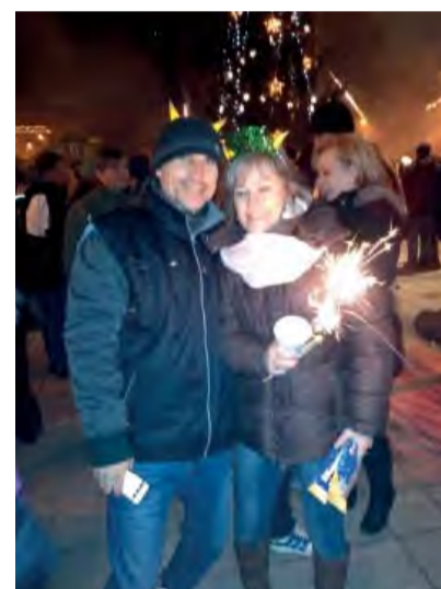
Silvestrovská zábava sa skončila až v skorých ranných hodinách.