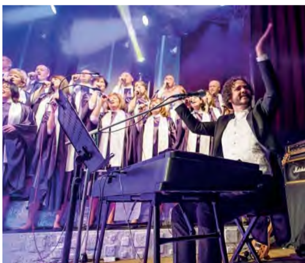
Jubilejný desiaty ročník koncertu zožal veľký úspech.

V roku 2006 začala kapela Boží Šramot písať históriu Trojkráľových koncertov, keď usporiadala jeden koncert v oratóriu saleziánskeho centra v Novej Dubnici. Do posledného miesta zaplnená sála povzbudila organizátorov ako aj účinkujúcich, koncert o rok zopakovať. Podarilo sa, a s veľkým úspechom.