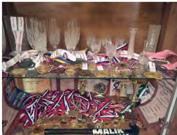
Skrinka plná ocenení svedčí o tvrdej práci a drine.