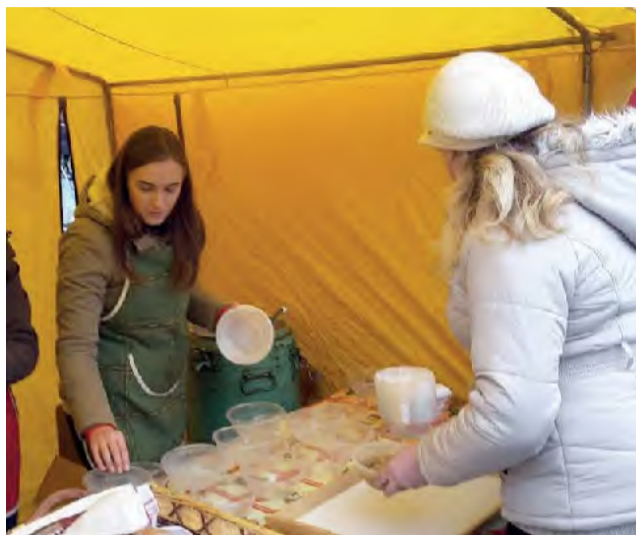
Podávala sa vianočná kapustnica, teplý čajik a panovala dobrá nálada.