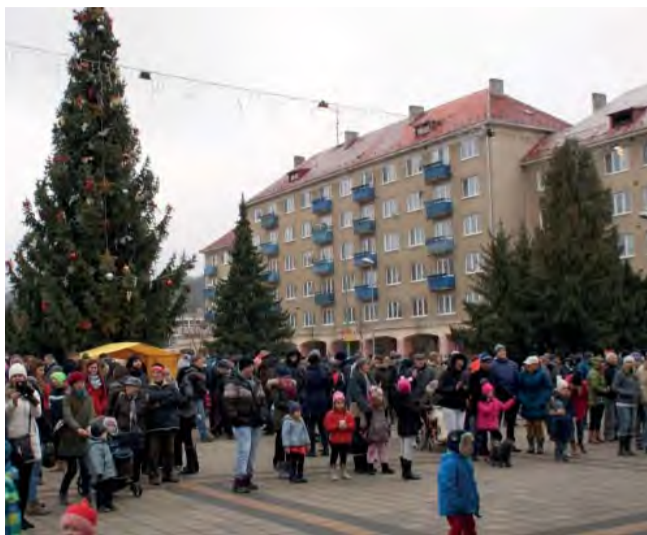
Na Štedrý deň sa na námestí zišlo množstvo Novodubničianov.