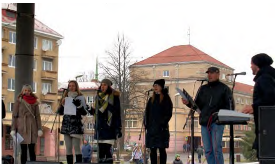
Sviatočnú náladu spríjemnili vianočné koledy v podaní Božieho šramotu.