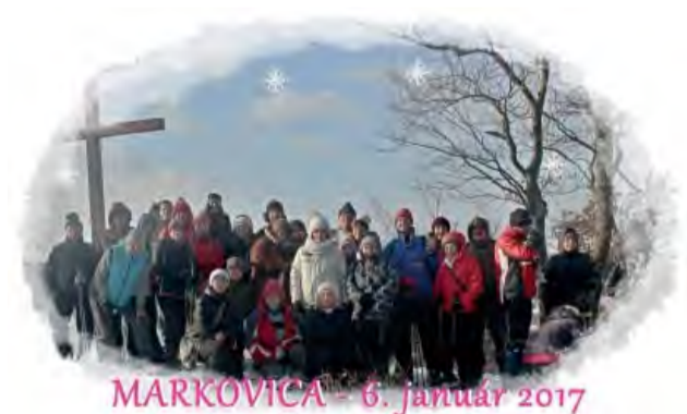
MARKOVICA - 6. január 2017

Klub slovenských turistov Kolačín každoročne organizuje na začiatku nového kalendárneho roka Trojkráľový výstup na Markovicu.