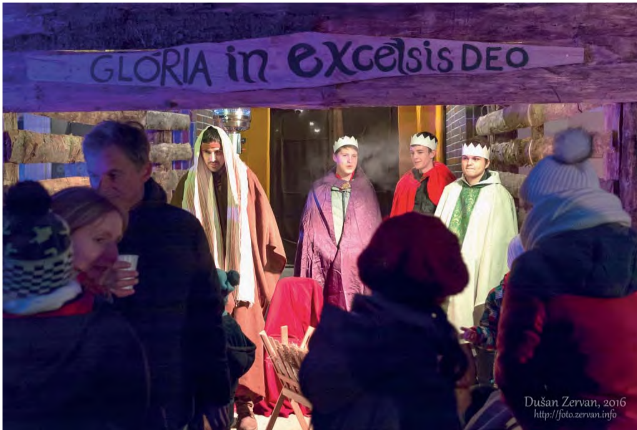
Pokloniť sa Jezuliatku prišli aj traja kráľi.

V Spojenej škole sv. Jána Bosca v adventnom období po prvýkrát pre širokú verejnosť usporiadali podujatie Živý betlehem.