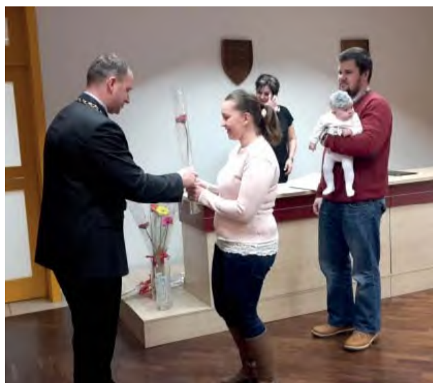
Primátor mesta potešil každú mamičku kvetom a darom.