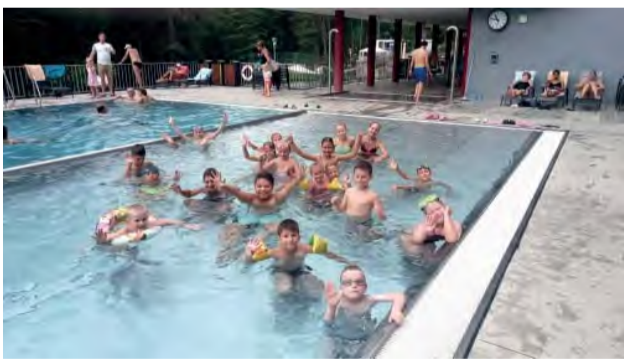
Centrum voľného času pripravilo pre deti počas letných prázdnin 4 prímestské tábory.

Deti prežili týždeň plný zábavy, hier, vody, slnka a nových zážitkov. Zároveň spoznávali aj okolité mestá, do ktorých sme cestovali MHD.