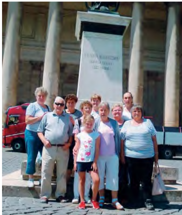
Seniory z Jednoty dôchodcov Slovenska z Kolačina Pred Bazilikou v Ostrihome.

Členovia Základnej organizácie Jednoty dôchodcov Slovenska v Kolačine (ZO JDS) sú aktívni počas celého roka.