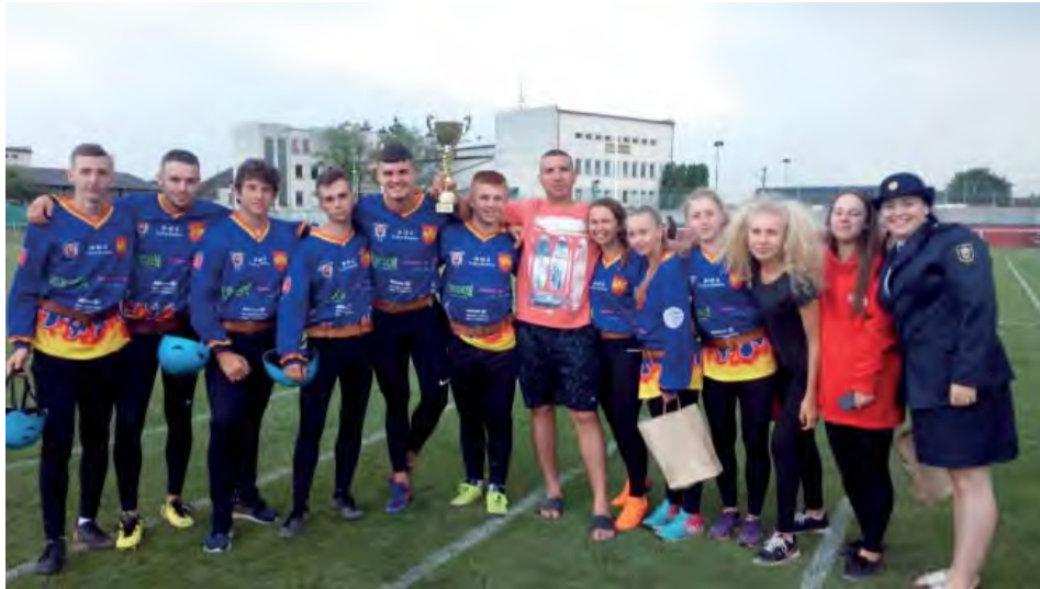
Aj tento rok sa mladým hasičom z Kolačina darilo na množstve pretekoch.

Leto je jedným z tých období, v ktorom sme my, hasiči, najnapätejší. Nielen kvôli možným požiarom z tepla, ale i z dôvodu ukážky našej pripravenosti.