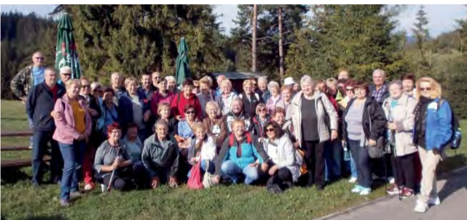
Nezabudnuteľné zážitky na Orave si užívali seniori JDS.

Na Orave dobre, na Orave zdravo - spieva sa v ľudovej piesni a našich 51 seniorov si išlo overiť, či je to tak. Neistá, no túžobne očakávaná dovolenka sa nakoniec uskutočnila v stredu 2. septembra.