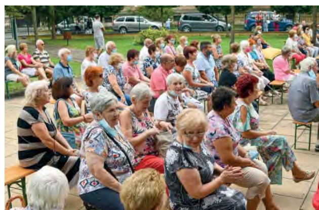
Piesne Karola Duchoňa stále milujú všetky generácie.