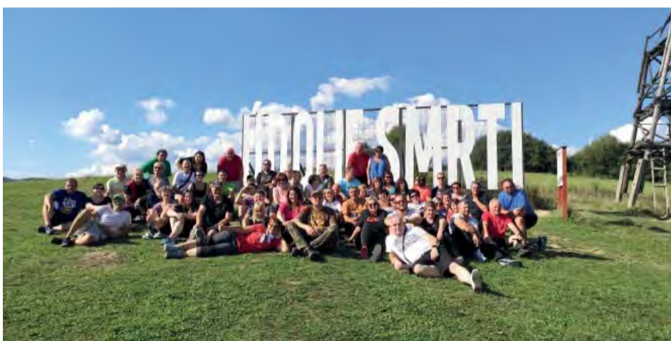
Jasný deň a nádherná príroda, myšlienky však nemohli nemyslieť i na životy, ktoré tu vyhasli počas povstania.

Vďaka dotácii z mesta Nová Dubnica malo 57 členov a sympatizantov Klubu slovenských turistov Kolačín možnosť presvedčiť sa o nepravdivosti výroku o tom, že na Východe nič nie je. Zorganizovali si výlet do okolia Sniny, aby odtiaľ každý deň objavovali jeden poklad za druhým.