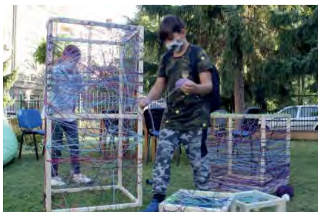
Priestorový objekt z dielne Školy umeleckého priemyslu bol jednoduchý, zároveň deti fascinoval po celý deň.