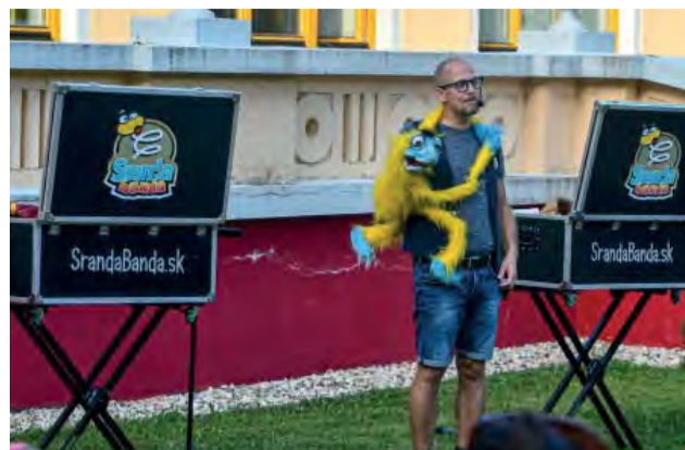
Originálne postavičky SrandyBandy Obluda Korki, Drzák Elvis a Šialený Lenny bavili divákov 23. augusta.