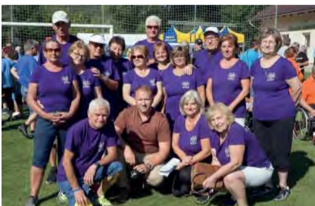
Silný tím ZO SZPP prišiel podporiť i primátor Novej Dubnice.

Dňa 28. 8. 2020 Okresná rada SZPP v Ilave usporiadala VI. ročník celoslovenských športových hier zdravotne postihnutých dospelých, detí a mládeže, ktorý sa konal v Košeckom Podhradí.