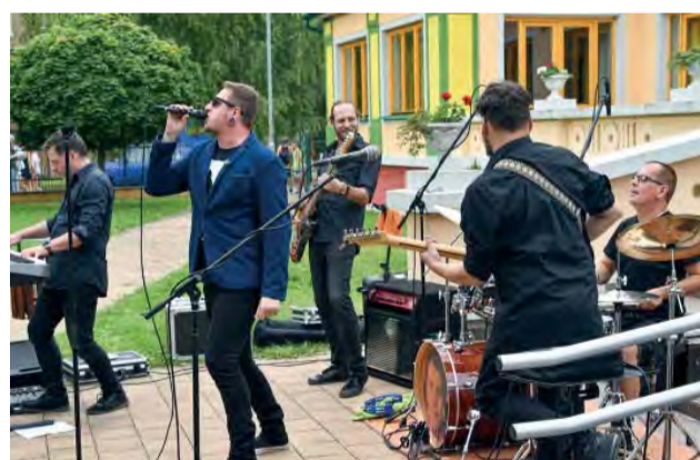
Novodubnické kultúrne leto končilo 30. augusta hitmi ako Hraj, hraj, Dievča z Budmeríc či Čardáš dvoch srdc.