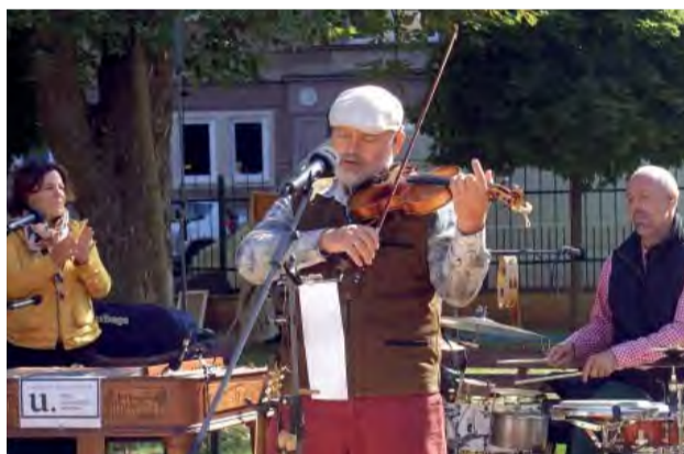
Banda nám ponúkla koktejl, v ktorom slovenský folklór zmiešala s hudbou celého sveta. Chutil vynikajúco.