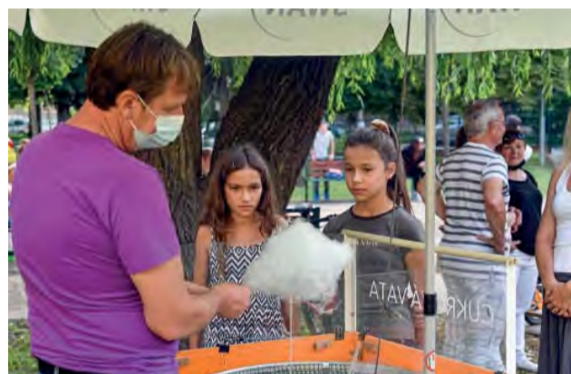
Cukrová vata od Swanu - sladká bodka za vystúpením.