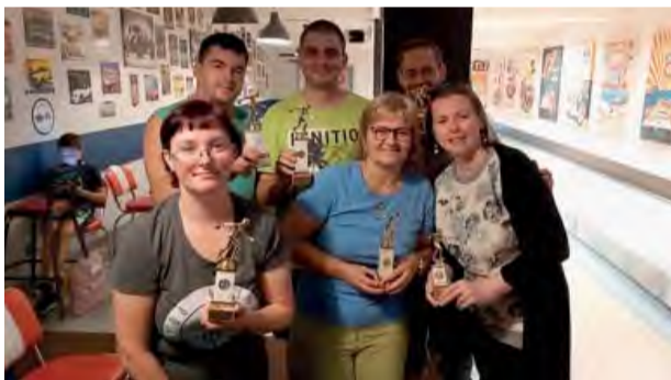
Vítazi jesenného turnaja.

Dňa 28. augusta 2020 centrum nepočujúcich ANEPS Nová Dubnica usporiadalo pre svojich členov turnaj v bowlingu.