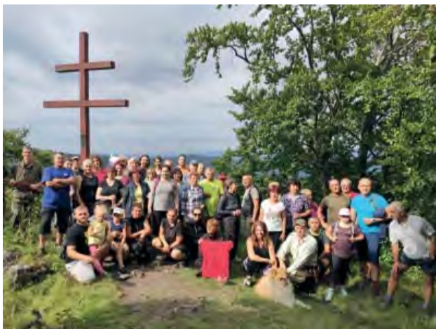
Krásny augustový deň zlákal k výstupu veľa turistov.

Klub slovenských turistov Kolačín zorganizoval aj v tomto roku výstup na Markovicu, kde sa v sviatočný deň, 29. augusta, pri kríži stretlo viac ako 70 turistických nadšencov, aby si, okrem príjemnej prechádzky, zaspomínali na časy dávno minulé.