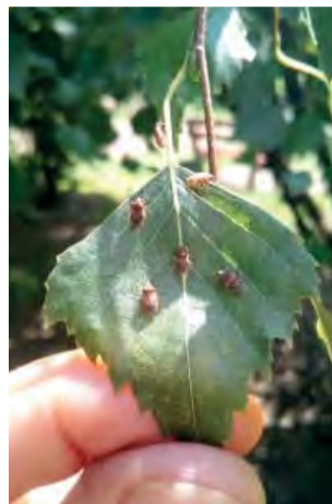
Bzdôšky nie sú nebezpečné, ich premnoženie však môže byť rušivé.

na prezimovanie v blízkosti miest, kde sa vyvíjali. Preto sa snažia a ešte nejakú dobu sa aj budú snažiť dostať do bytov, ktoré pre ňu tvoria prirodzené miesto na prezimovanie. Jedným zo spôsobov obrany môže byť použitie okenných sietí proti hmyzu a lepových pásov alebo obojstrannej lepiacej pásky okolo okien, čo