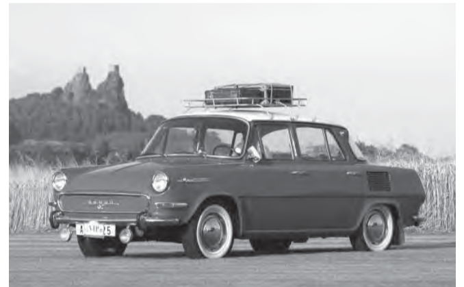
Legenda Škoda 100 - jej prvé kusy boli vyrobené v Mladej Boleslavi v auguste roku 1969.