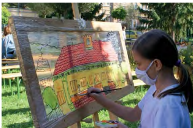
Malá maliarka Lucka práve v tento deň objavila v sebe skvelý výtvarný talent.