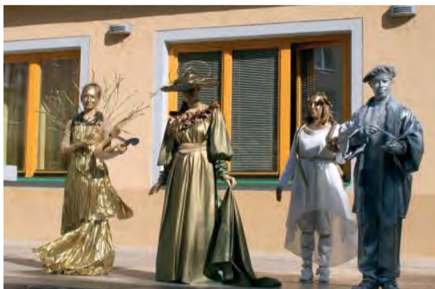
Mýtické múzy umenia podtrhli ušľachtilosť a harmóniu tohto dňa.

Štyri nádherné múzy umenia si v piatkové dopoludnie vzali vládu nad parčíkom Kultúrnej besedy. Múza výtvarného umenia inšpirovala miestnych výtvarníkov i deti novodubnických škôl. Pod ich štetcami či sprejmi vznikali tajomné otačky, neviditeľné obrazy a siluety hudobníkov. Muzikanti hrali očarovaní múzou hudby skladby folklórne, vážne, moderné, ale i všetko medzi tým, lebo hranice štýlov prakticky prestávajú existovať, ostáva len hudba.